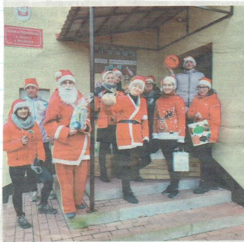
Organizatorzy i uczestnicy kolejnego już okolicznościowego biegu.