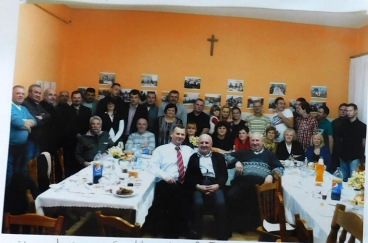
Uczestnicy spotkania Opłatkowego X. 2014'