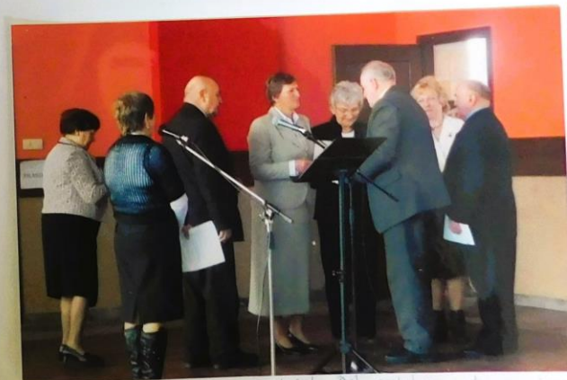
Na zdjęciu Panie z KGW Bilaszkowice otrzymujące dyplomy.