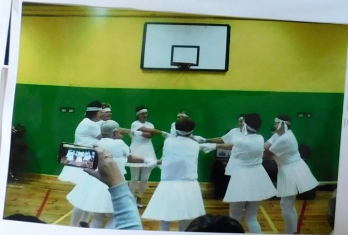
Pani z KGW Zielkonice podczas przedstawienia "Jeszcze tak dale"