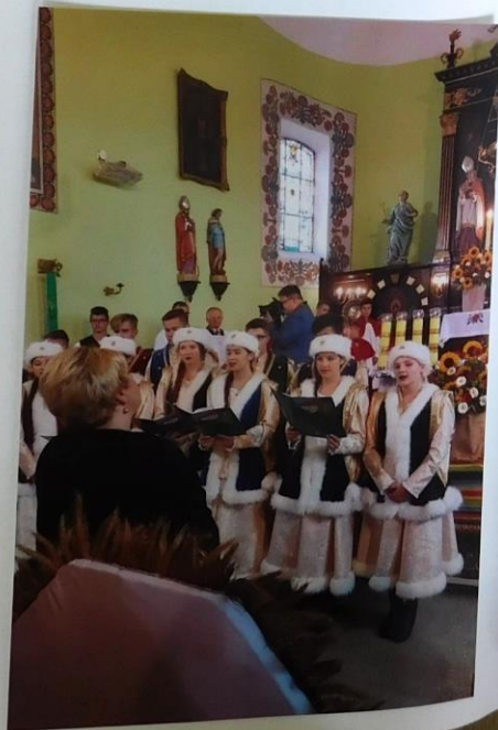
Na zdjęciu występ zespołu Blichoniacy