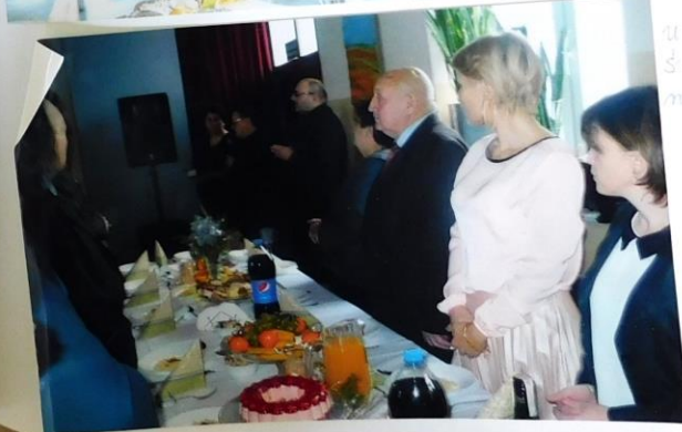
Uczestniczą w spotkaniu z okazji powstania wspólnej modlitwy