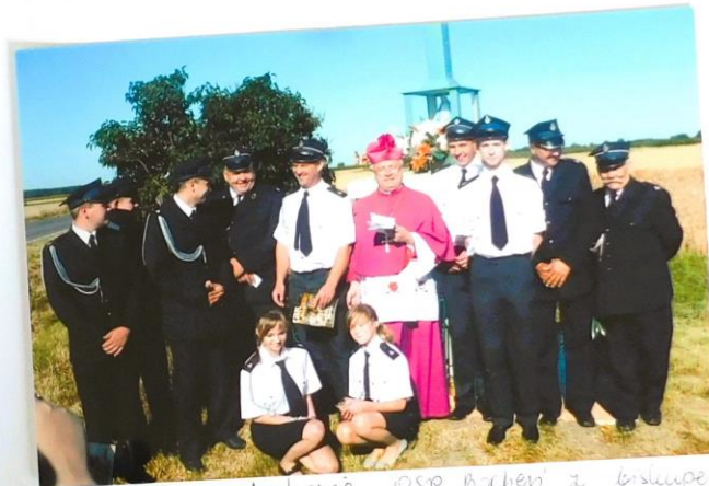
Żukmy i dnuhomé OSP Bochen z biskupem