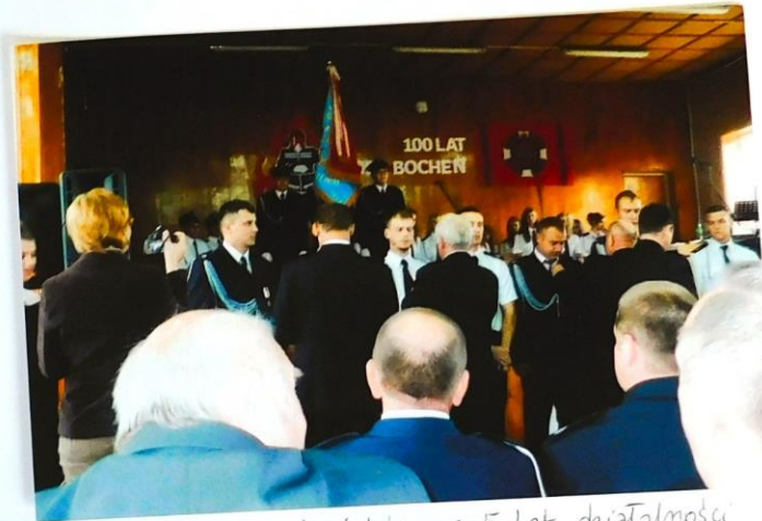
Odznaczenie strażaków za 5 lat działalności w OSP Bochów