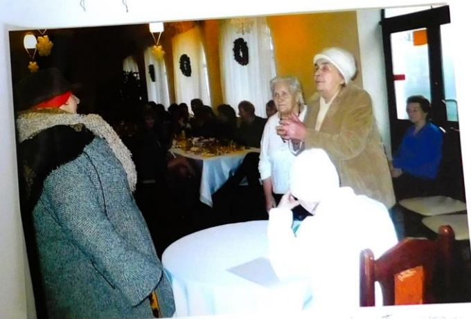
Panie z KGK Strzelców reprezentowały siostry.