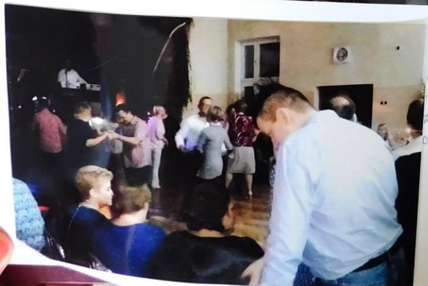
Włażka z rodziną mieszkańcami i mieszkańcami Kobrony po czas konkursu