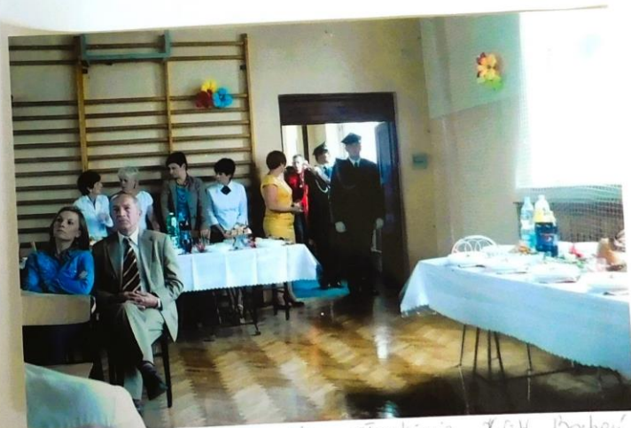
Pod drabinkami w tle członkowie K&K Bochów