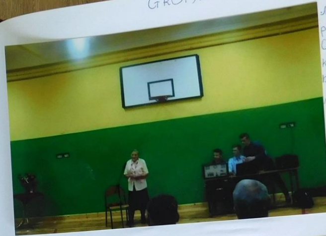
Ma adżeci p. Inna Gratazka, która ad- była i miejsce