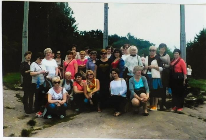
Na zdjęciu uczestniczki wyjazdu