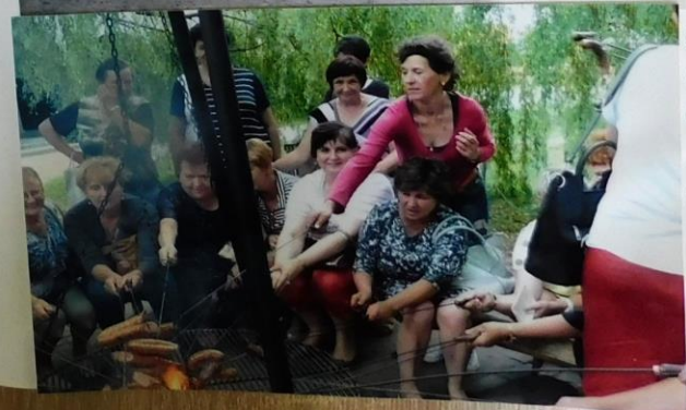
Członkowie z KKK różnych gmin podczas integrowania się przy grillu