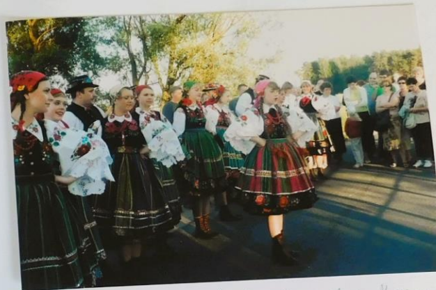
Występ zespołu folklorystycznego: Masovia