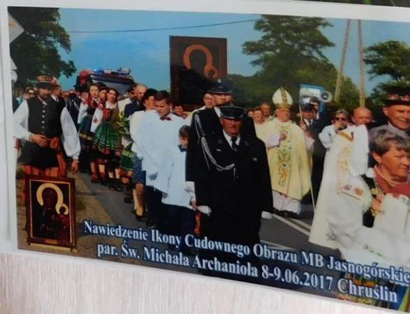
Nawiedzenie Ikony Cudownego Obrazu MB Jasnogórskiej par. Św. Michała Archanioła 8-9.06.2017r. Chruslin