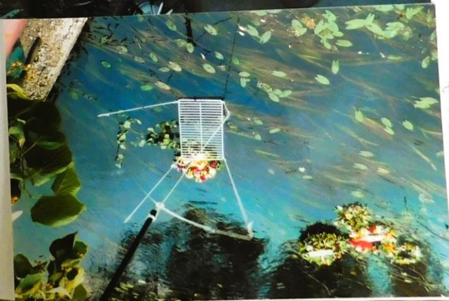
Wianki z KGK z gminy Łowicz.