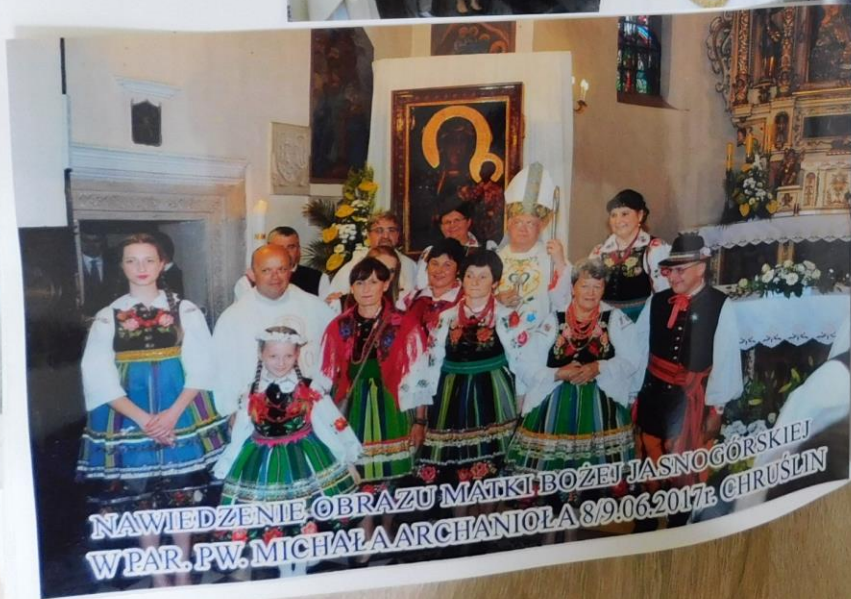
NAWIEDZENIE OBRAZU MATKI BOŻEJ JASNOGÓRSKIEJ W PAR. PW. MICHAŁA ARCHANIOLA 8-9.06.2017r. CHRUSLIN