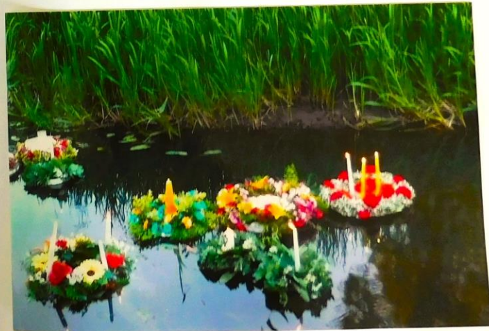
Wianki KGH z Gminy Łoniew.