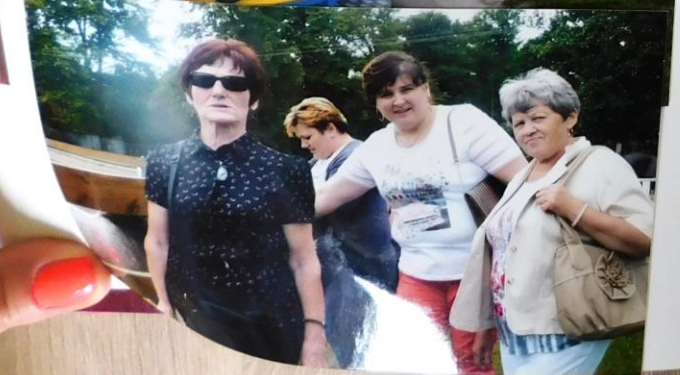
Na zdjęciu Członkowie KKK w Bocheniu na Karuzeli