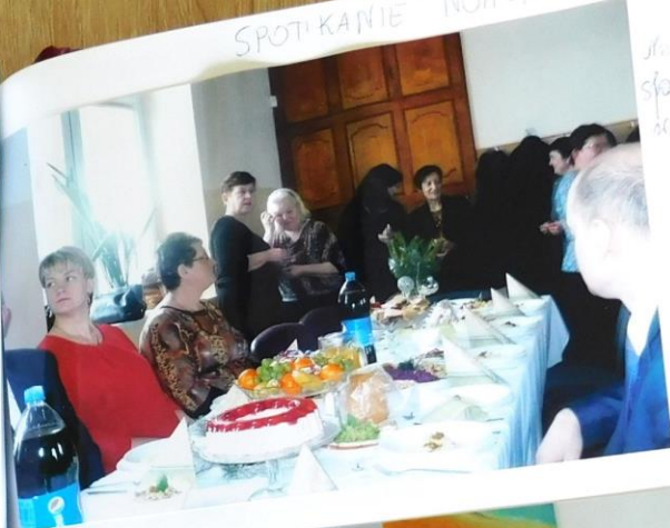
Na zdjęciu uczestniczą w spotkaniu opłatek w Łdunach.