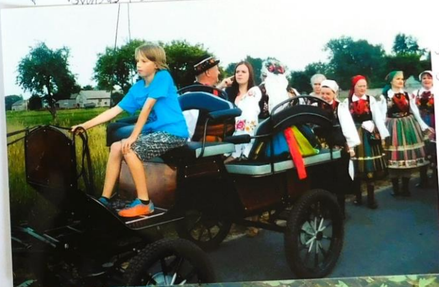
Na zdjęciu członkinie zespołu Księżola.