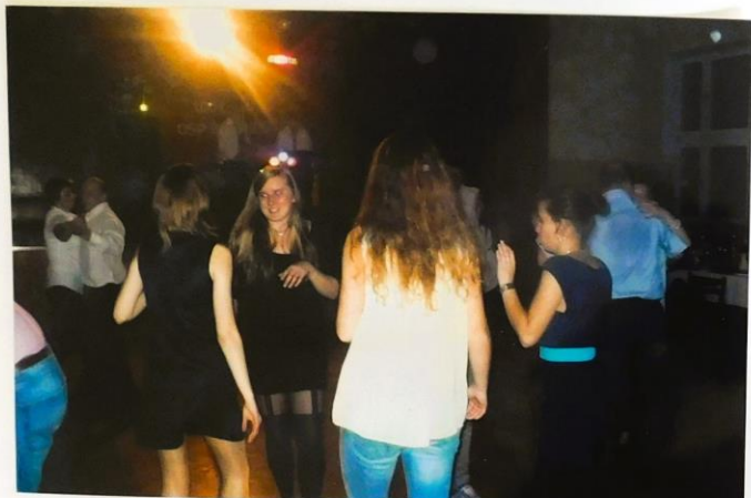
Młodzi bawita sig na "imprezie Andzejkovej"

Oprócz tanca, pomocnikiem młodziu zabawy mogli brać udział w konkursach, pomagajac sobie.