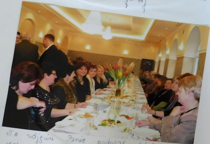
Na zdjęciu Pani podczas obiadu w restauracji Polonia.