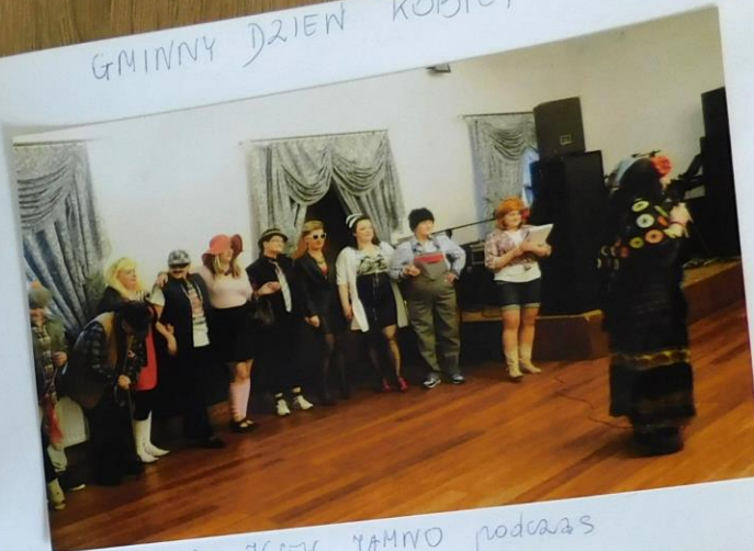
członkinie KGW JAMNO podczas swojego występu