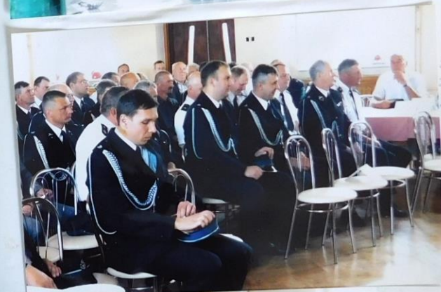
Straznicy z Gminy Łomża