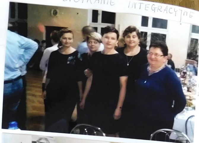
całkowicie 2014 Białystok