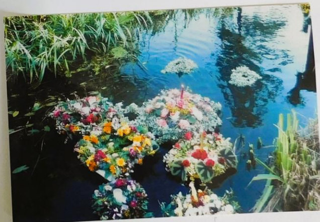
Wianki KGW w Gminie Łonia