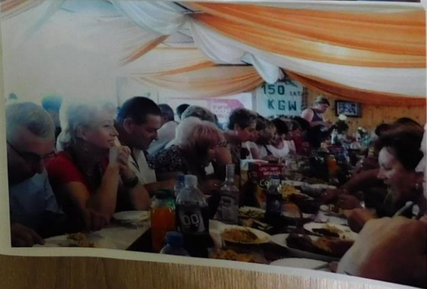
Na zdjęciu delegacja KOK