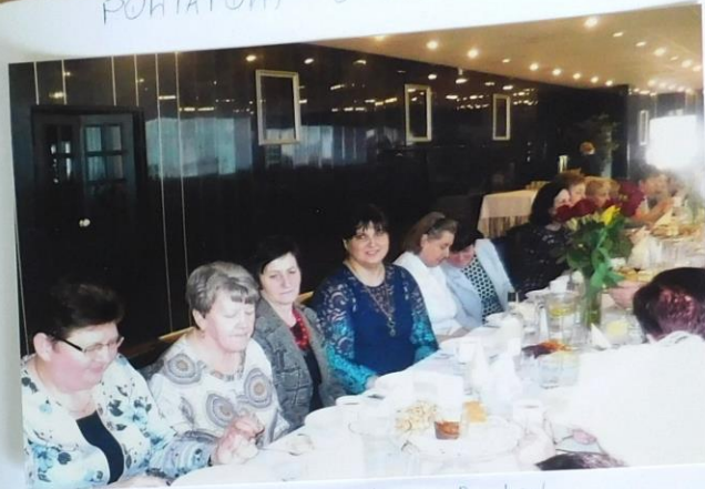
Pani reprezentująca Kłm Bocheńskie