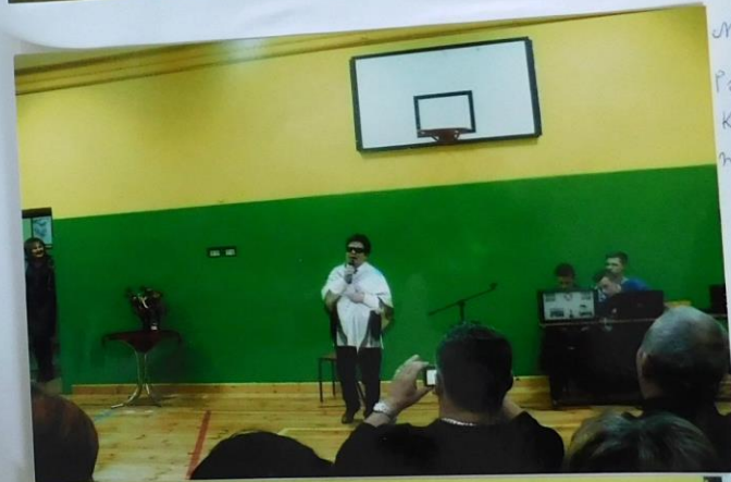
Ma adżeci Pani z KGW Zielko- nicy