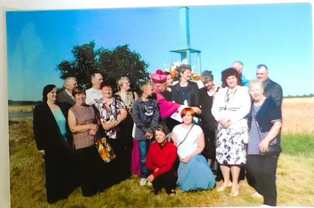
Na wdjęciu mieszczanki Bochenia w ekscelencje biskupem Józefem Lantkowskim