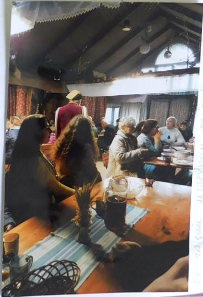
pożyczyła w gospodarstwie agroturystycznym w Olshynie