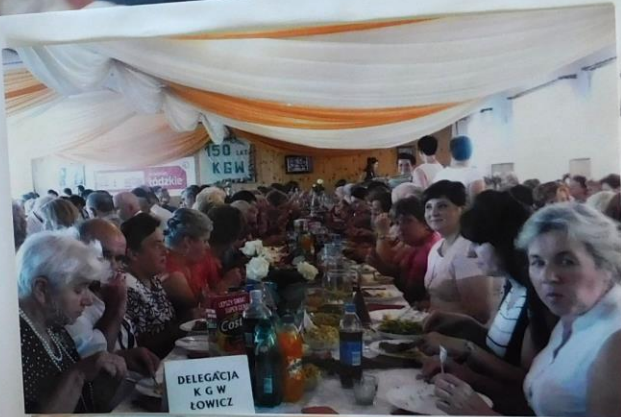
Na zdjęciu delegacja KOK Łowice