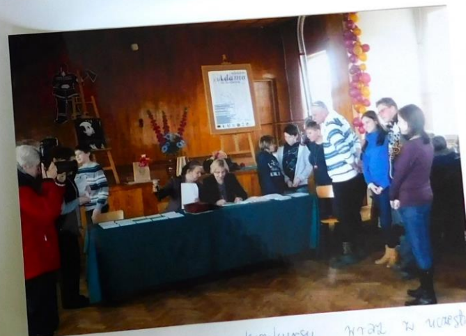
Na zdjęciu Komisja konkursu wraz z uczestnikami.