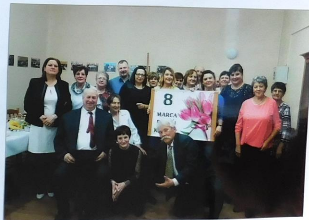
Na zdjęciu uczestnicy Śnięta Kobiet w Bocheniu