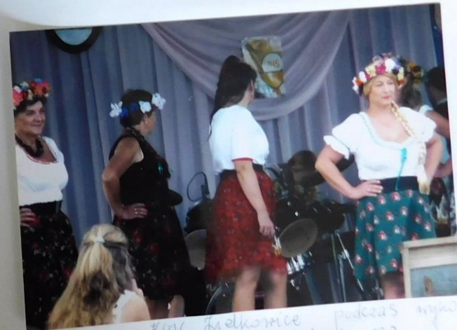
Pani z KGW Dąbkowice podczas wyko- nania skeczu dożynkowego