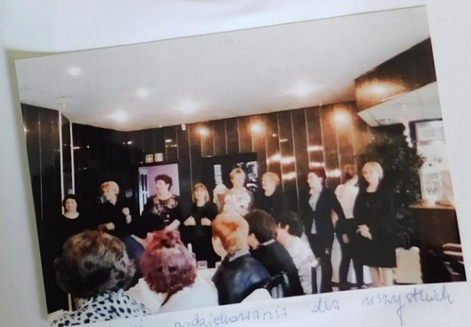
na zdjęciu podziękowania dla wszystkich przewodniczących gminnych