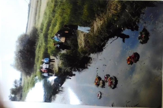
Wianki KGH z Gminy Łowicz