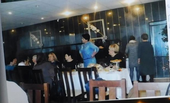
Uczestniczki spotkania podczas śpiewania kolęd