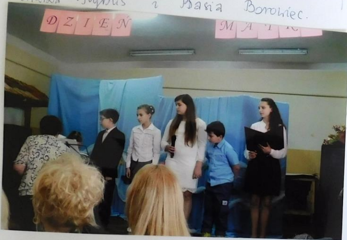
Na zdjęciu przedstawienie i wykonanie młodzieży z Kalisza