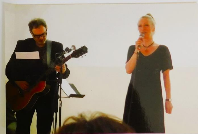
Koncert w Mieboronie artystów zespołu z Marszany