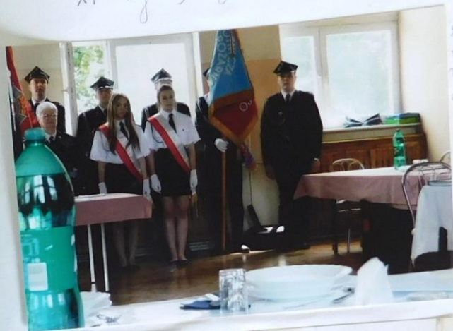
Straznicy i drużyna z OSP Bocheni