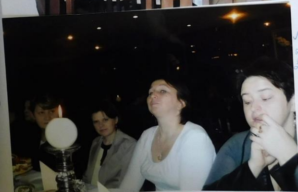
Na zdjęciu panie z kłosa gmina Łysaków