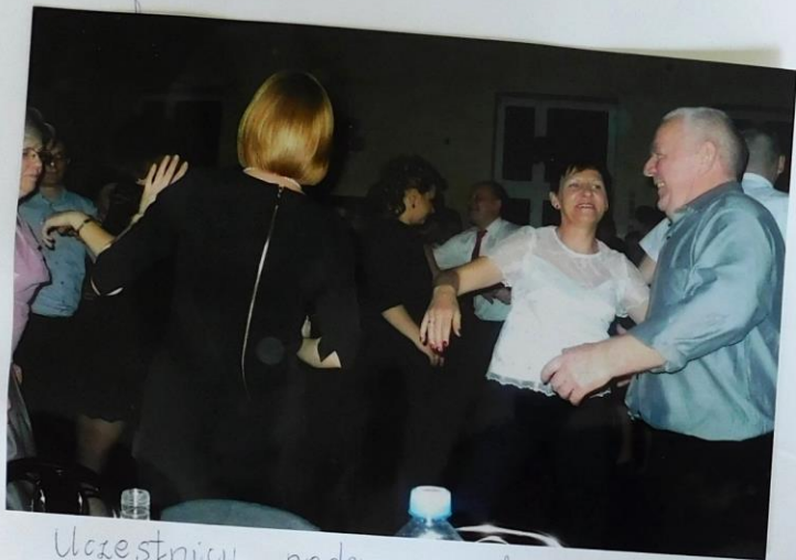
Uczestnicy podczas zabawy

WALENTYNKI 14.02.2015' w Domu Ludowym w Bochenie odbyła się zabawa walentynkowa - ostateczna na której bawili się mieszkający dokoła bliscy.