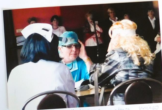
Panie z KGW Lielkonic podczas swojego występu.