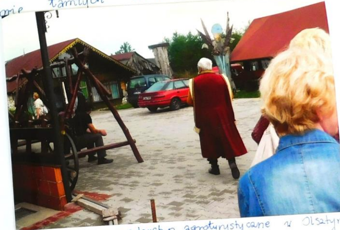
Na zdjęciu gospodarstwo agroturystyczne w Olsztynie. (na środku właściciel) W następnym miejscu, które było w programie zwiedzania był Leśnicz.